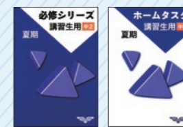
使いやすい5教科合冊テキスト

授業と連動した 家庭学習教材 「ホームタスク」 類題演習を重ねることで、 理解した内容を“使える力” へと高めます。