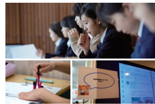
(夏期集中特訓より)