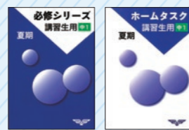
使いやすい5教科合冊テキスト

授業と連動した 家庭学習教材 「ホームタスク」 類題演習を重ねることで、 理解した内容を“使える力” へと高めます。